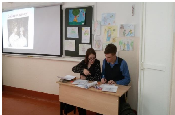
Подведение итогов игры