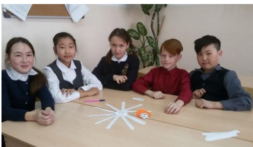
конкурс «Собери ромашку»