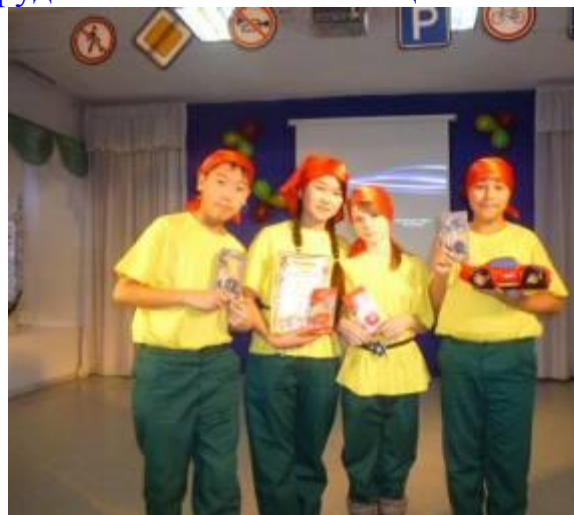
«Безопасное колесо-2013», 1 место