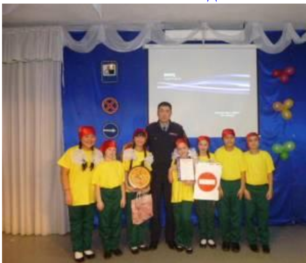
Конкурс агитбригад ЮИД, 1 место