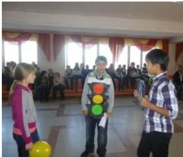
Пропаганда среди сверстников