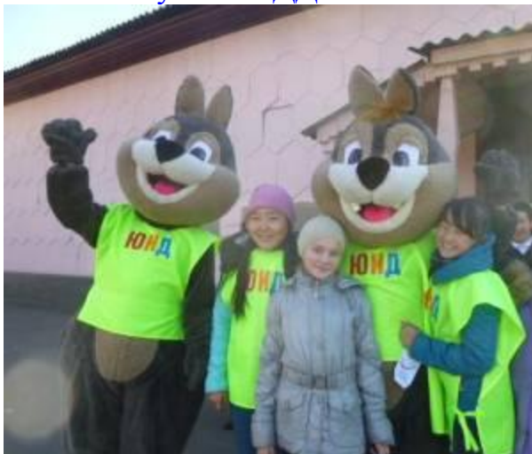
Оказываем содействие сотрудникам Госавтоинспекции